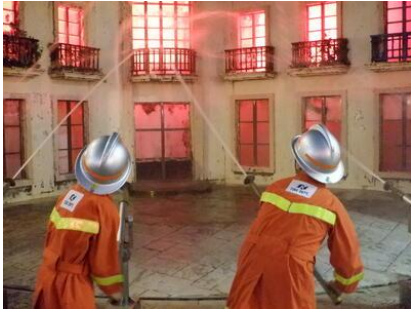
キッズニアでの体験