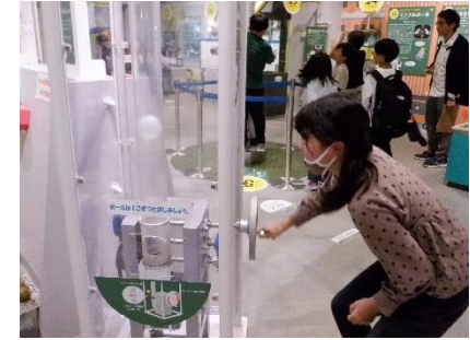
コニカルタサイエンスームでの体験