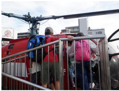
新宿消防博物館の見学