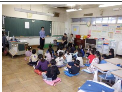
おはなし会の読み語り