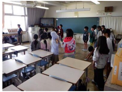
なかよし班での遊び