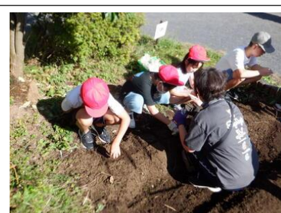
種まき(ひばり学級)