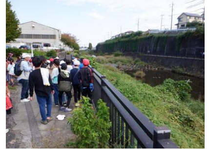
災害の歴史をたどる【4年生】