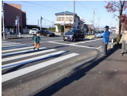
地域の皆様による安全見守り