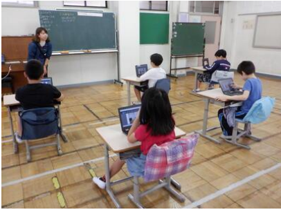
在宅避難を考える【ひばり学級】