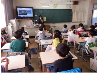
ひなんについて考えよう【2年生】