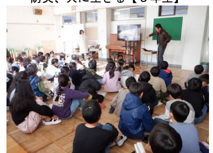
防災、共に生きる【5年生】