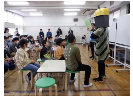
安全学習【ひばり学級】