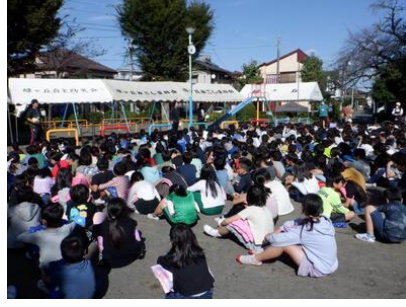
二次避難場所への避難