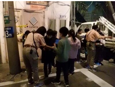
そなエリアの体験【4年生】