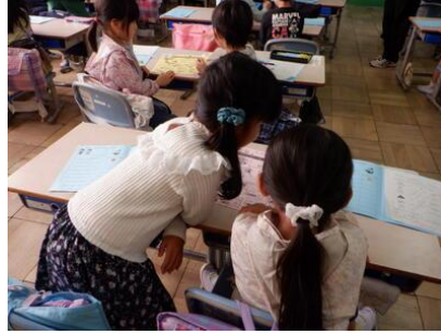
めざせ!ぼうさいはかせ【1年生】