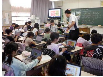
ふるさと安全たいから学ぼう【3年生】