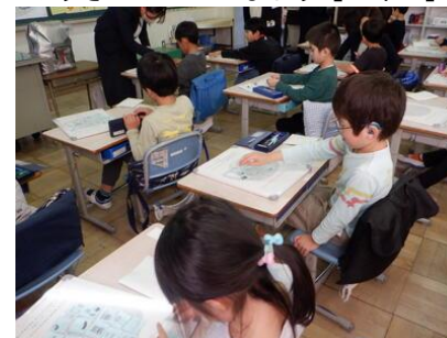
ぼうさいはかせになろう【1年生】