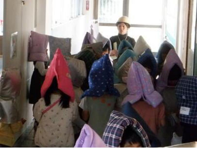
予告なしの避難訓練