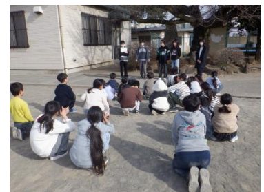
たて割り班の6年生にありがとう！

今夜、おうちの方が真剣に作った晩ご飯にも「おいしかったよ！ありがとう！！」と自然に言えるような潤徳の子に育ってほしいと思います。