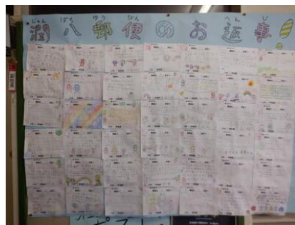
潤八なかよし大作戦