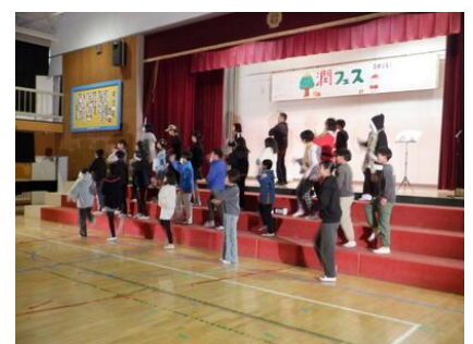
潤フェス×クリスマス 2025

プロジェクトを通じて、学校は「与えられる場所」から「自分たちで創り出す場所」へと進化し続けています。丙午の今年は、その勢いをさらに加速させる時です。馬は群れで走りますが、一頭一頭が自分の足で力強く地面を蹴っています。誰かが決めたレールを走るのではなく、自分たちのアイデアという「火」を燃やし、新しい学校のカタチを自らの手で描き出してほしいと願っています。