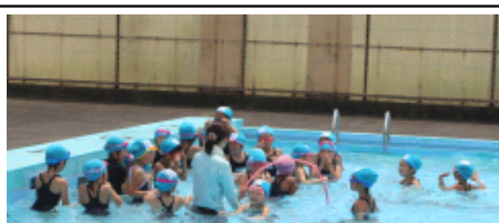
水中にもぐってフラフープをくぐります