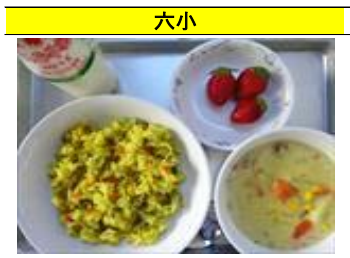
アロスコンポーヨ・クリームシチュー・いちご・牛乳

新天皇の即位に際して献上した東光寺大根を余す所なく使用したメニュー「東光寺丸ごと御膳」R2年度全国学校給食甲子園東京都代表に選ばれました。