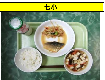
麦ご飯・鯖の味噌煮・煮びたし・けんちん汁・牛乳

どの学年も大好きな揚げパンとフルーツポンチです。リクエスト給食ではいつも上位に入っているメニューです。