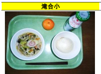
五目タンメン・肉まん・みかん・牛乳

家庭科の授業の中で、6年生が考えた献立です。大好きなハンバーグに金平を入れて、バランスよくおいしいメニューを考えてくれました。