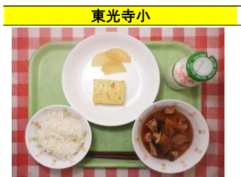
ご飯・東光寺大根の金平・じゃが芋の卵焼き・ぶり大根・牛乳

潤徳小の味噌ラーメンのだしは、豚骨や鯉節、りんごやセロリも入れてとり、仕上げの隠し味にバターを使用しています。