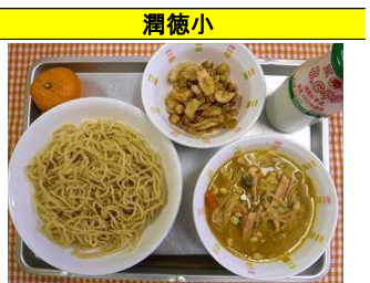
味噌ラーメン・甘辛豆ごぼう・みかん・牛乳

目の愛護デーにちなんだ献立。日野産ブルーベリーを贅沢に使いソースを手作りし牛乳かんにかけました。