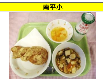
きなこ揚げパン・西湖豆腐・フルーツポンチ・牛乳

1年生が育てて収穫した大根で作る、旭小名物献立。甘みがある大根でべっこう煮、葉はご飯に混ぜ込みました。