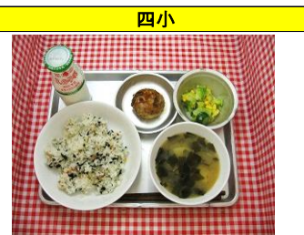
わかめご飯・金平ハンバーグ・きゃべつとコーンのサラダ・じゃが芋とわかめのみそ汁・牛乳

「いかのレモン醤油」は人気メニューの一つです。今年度のリクエスト給食では上位にランクインしました。毎回おかわり争奪戦になります。