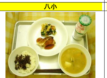
ご飯・ちりめんゆずふりかけ・鯛の照り焼き・白菜のおかか和え・田舎汁(カボチャ)・牛乳

生地を練って具を包み丸く成形する、一連の作業を調理員さん総出で作りました。肉汁あふれるふんわり肉まんは子供たちにも好評でした！