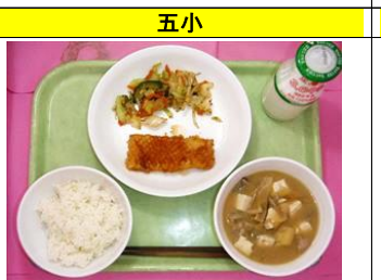
ご飯・いかのレモン醤油・野菜のゆかり和え・豚汁・牛乳

東京オリンピック大会が無事に開催できますようにと願いながら、コロンビア料理を給食バージョンにアレンジして作りました。