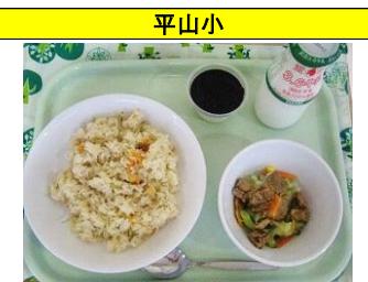
じゃこねぎマヨチャーハン・スタミナサラダ・牛乳かんのブルーベリーソースがけ・牛乳

冬至の日にかぼちゃを食べてゆず湯に入るといふ風習があります。これは、湯治(とうじ)をして融通(ゆうずう)よく暮らせますようにという願いが込められています。