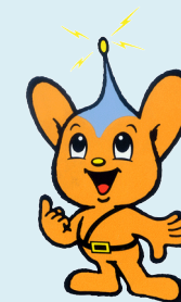
ピーポくん 警視庁 シンボルマスコット

特殊詐欺で逮捕された少年3名に対し、インタビュー形式で聞き取りをしたものです。各警察署少年係へ連絡の上、利用できます。